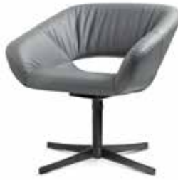
AV 652 PL