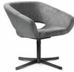
AV 652 PS