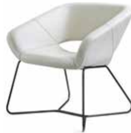
AV 692 PS